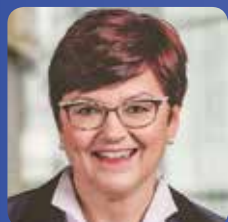
Inge Gräßle MdEP

Am 26. Mai 2019 ist Europawahl. Die CDU-Liste ist die einzige Liste, bei der Sie nur Kandidatinnen und Kandidaten aus Baden-Württemberg wählen. Ihre Stimme für Baden-Württemberg und die Landesliste der CDU!